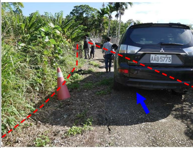
2. 原有PC路面損壞改善，於排水適當處增設截水溝共2處