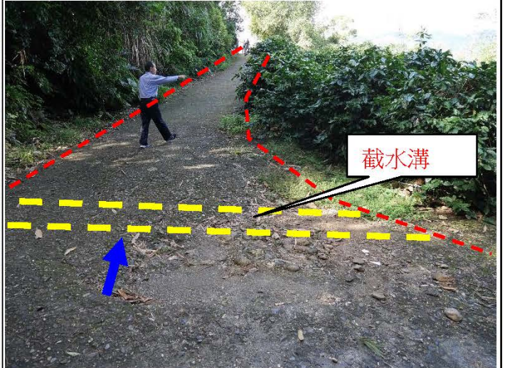
1. 路面改善起點X:259843 Y:2524473，箭頭表行進方向